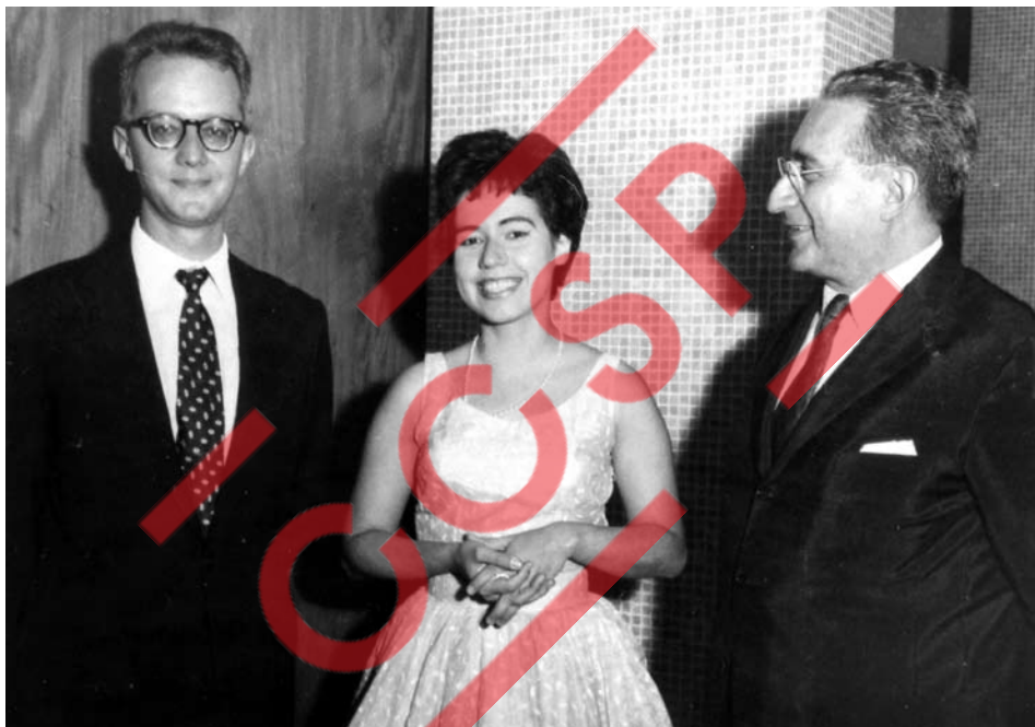
Osvaldo Lacerda, Eudóxia de Barros e Camargo Guarnieri. Década de 60.