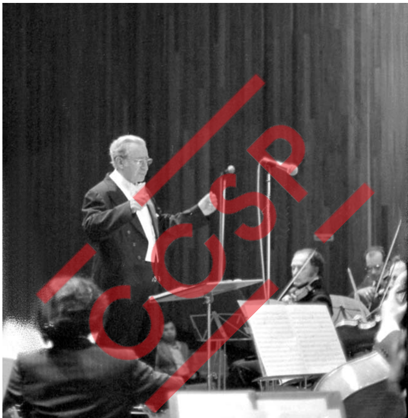
Camargo Guarnieri diante do público, agradecendo, junto a Orquestra Sinfônica da USP. Anfiteatro Camargo Guarnieri. 27 de maio de 1977.