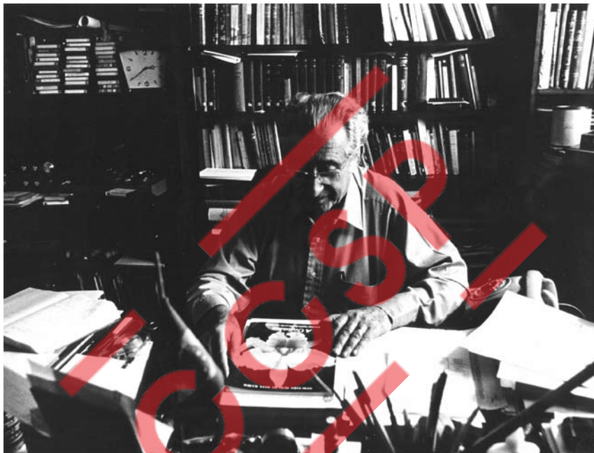
Camargo Guarnieri sendo entrevistado por pesquisadores da Equipe Técnica de Pesquisas de Música do IDART em comemoração aos 70 anos do compositor; realizada em seu estúdio em 23/09/77.