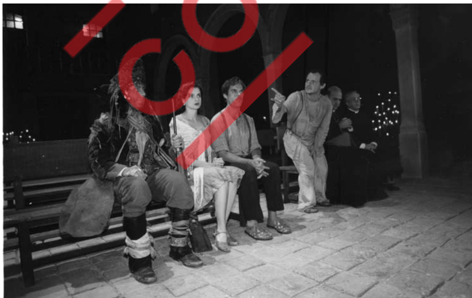
Auto da Compadecida - minissérie - Rede Globo - 1999. Na foto Marco Nanini, Denise Fraga, Diogo Vilella, Mateus Nachtergalle, Lima Duarte, Rogério Cardoso.