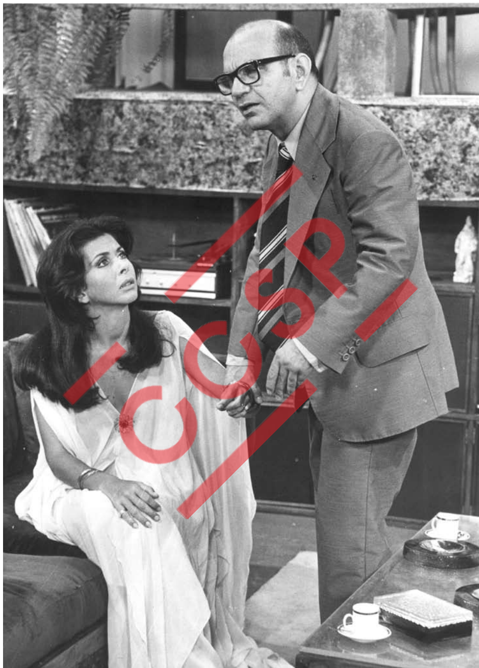
Pecado Capital - telenovela - Rede Globo - 1975. Na foto Betty Faria, Lima Duarte.