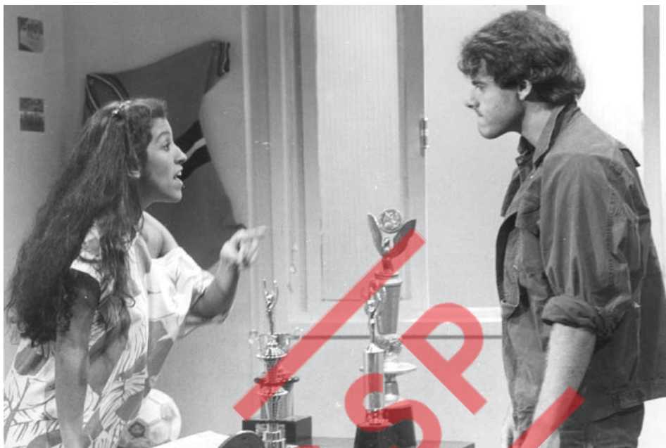
Vereda Tropical - telenovela - Rede Globo - 1984. Na foto Regina Casé, Mário Gomes. AMM.CCSP