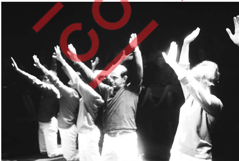
Arena Canta Zumbi. Teatro de Arena-1965. AMM.CCSP