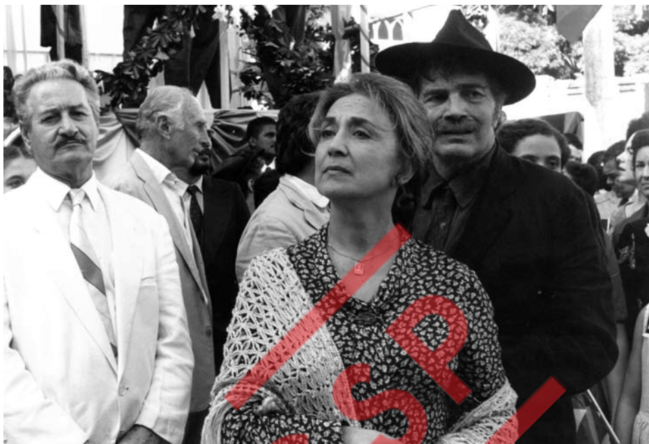
O Rei do Gado - telenovela - Rede Globo - 1996. Na foto Tarcísio Meira, Eva Wilma. AMM. CCSP