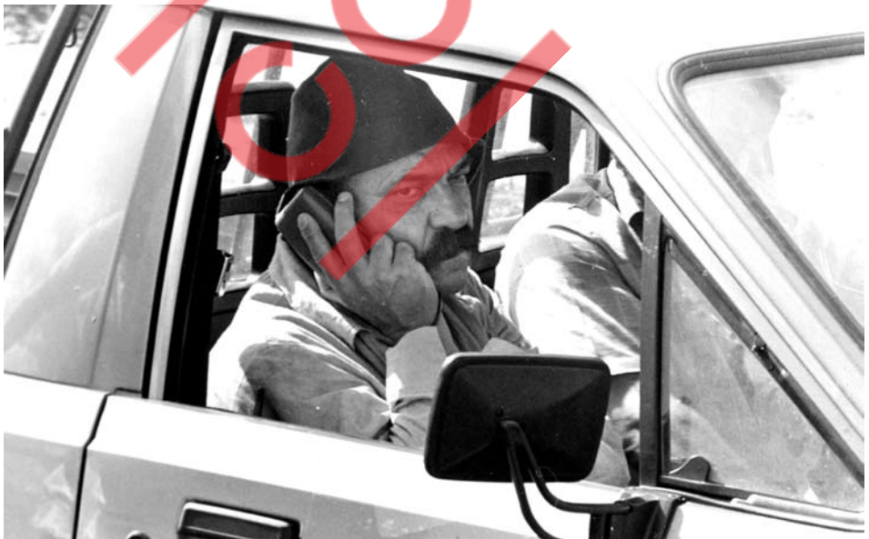
O Salvador da Pátria - telenovela - Rede Globo - 1989. Na foto Lima Duarte.