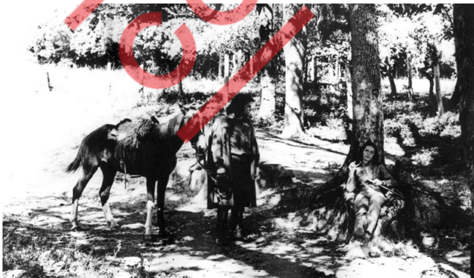
Meu pedacinho de Chão - telenovela - TV Cultura - 1971. Na Foto Maurício do Vale, Renée de Vielmond.