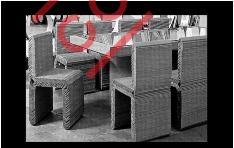
Cadeiras e mesa feitas de cantoneiras de papelão