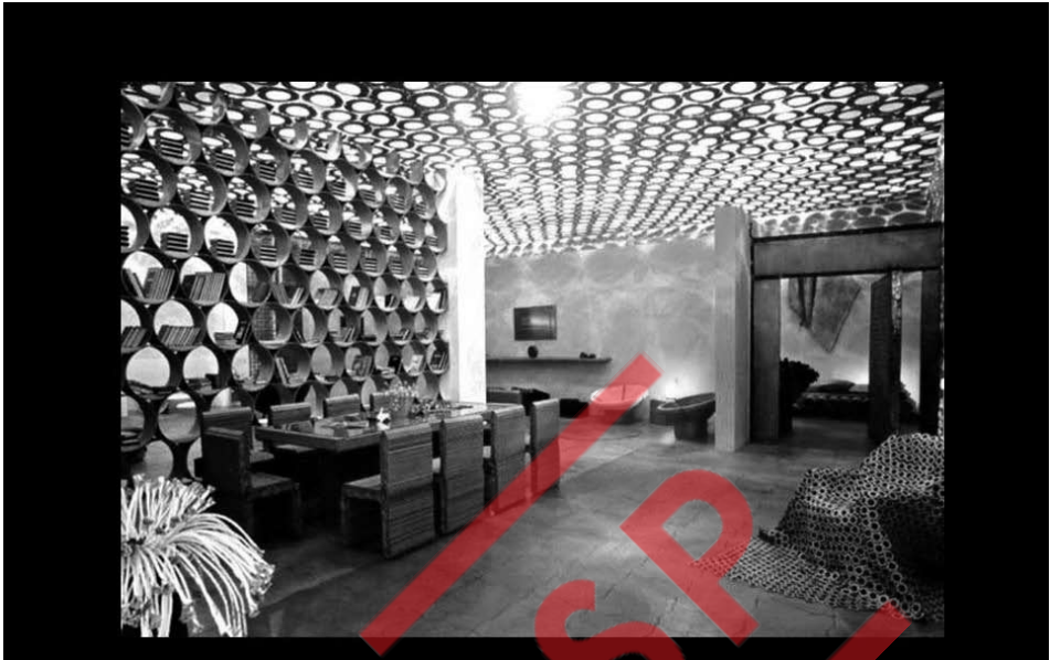
“Casa do Leitor”, ambiente produzido em papel e papelão. Mostra Brincadeiras de Papel, Sesc Belenzinho, São Paulo