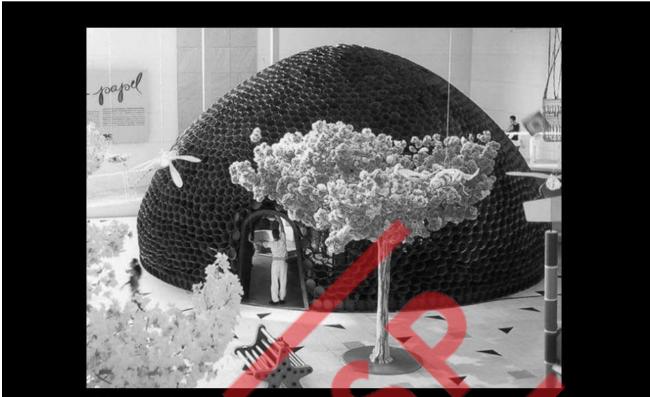
"Oca", Sesc Santo André, São Paulo