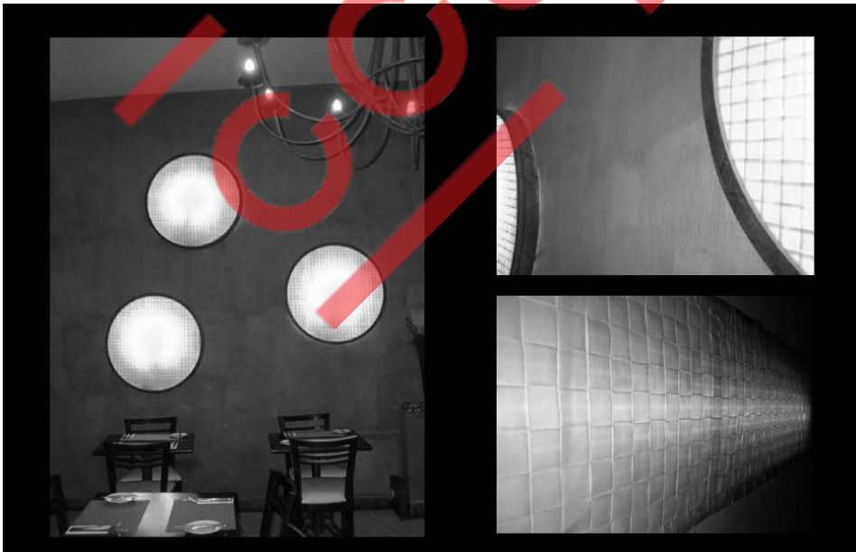
Luminárias de tecido de papel feitas para o Restaurante Coq. Rua Tupi, São Paulo