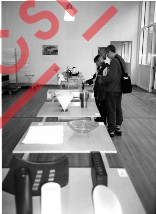
“Brasil Faz Design, Scuola Umanitaria”, Milão, Itália, 2000