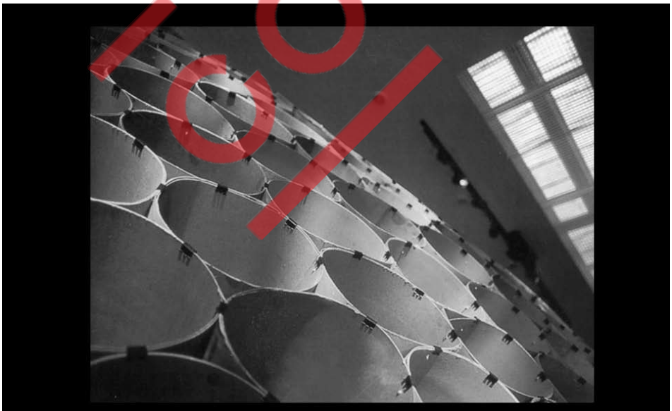
Detalhe da Oca, Sesc Santo André, São Paulo