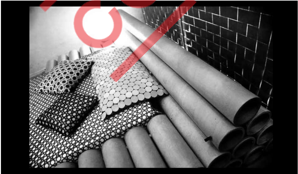
Detalhe "Quarto de Adulto", Sesc Belenzinho, São Paulo

O papel é aconchegante. Eu diria que ele tem a idéia do quente, da cor, da sensação de estar num espaço todo de papel. Tem também