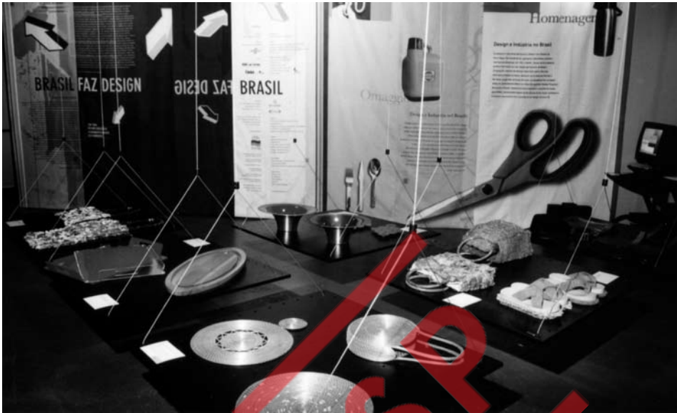
“Brasil Faz Design”, MuBE, São Paulo, 2002