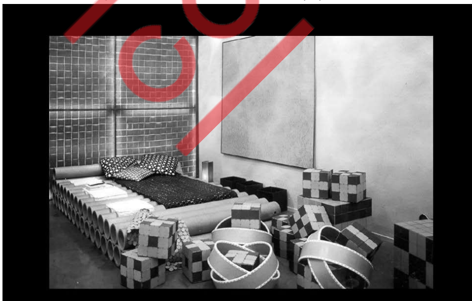
“Quarto de Criança”, Sesc Belenzinho, São Paulo