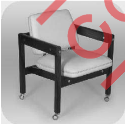
Cadeira em jacarandá e couro, 1957/1959.