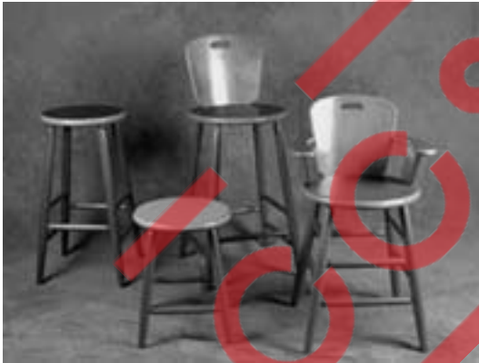
Linha São João