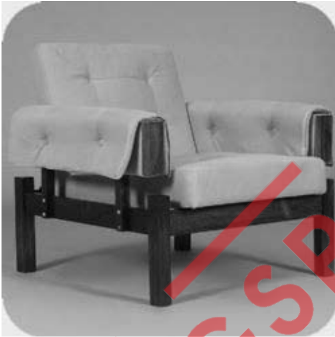
Poltrona em jacarandá e couro, 1962.