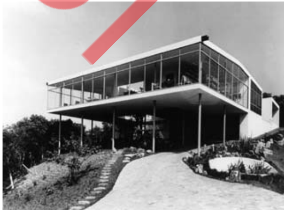
Sesc Fábrika Pompéia, em São Paulo, 1957 / 1969.