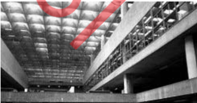
Área interna da Faculdade de Arquitetura e Urbanismo da Universidade de São Paulo, 1948.