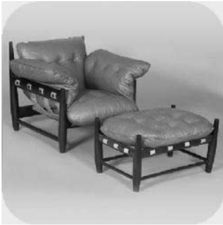
Poltrona Mole, em jacarandá e couro, 1957.