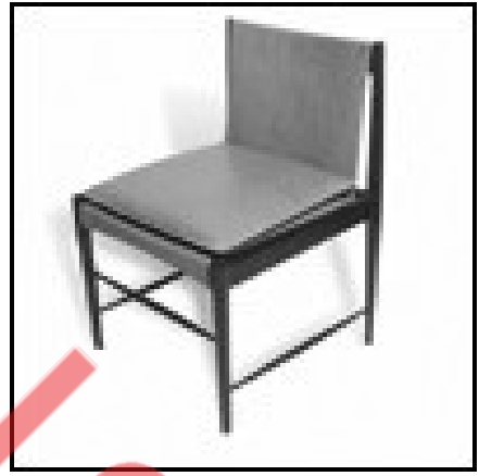
Cadeira Cantù Baixa, 1958.