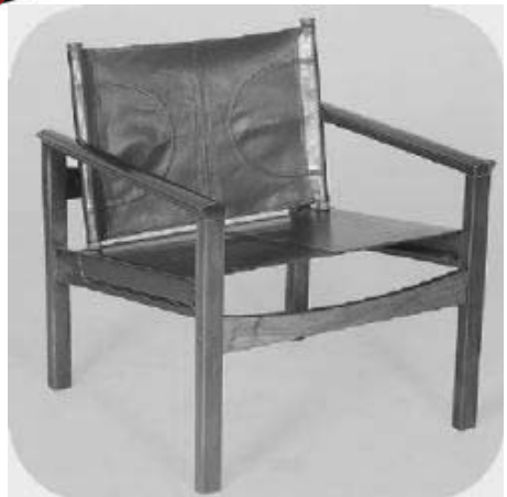
Poltrona Peg Lev, 1972.