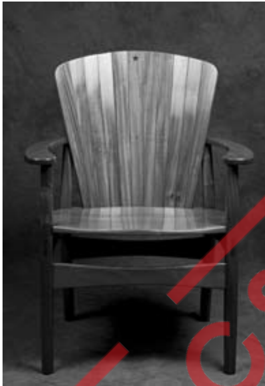
Cadeira Estrela