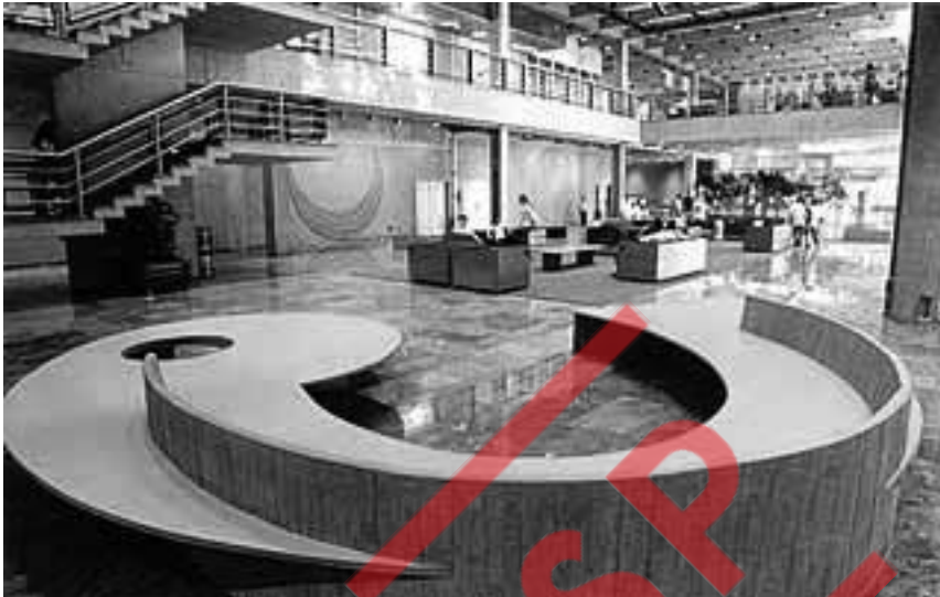
Área de convivência do Sesc Araraquara, 1991.