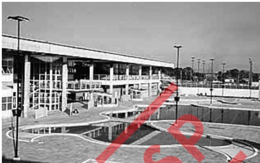
Área externa do Sesc Araraquara, 1991