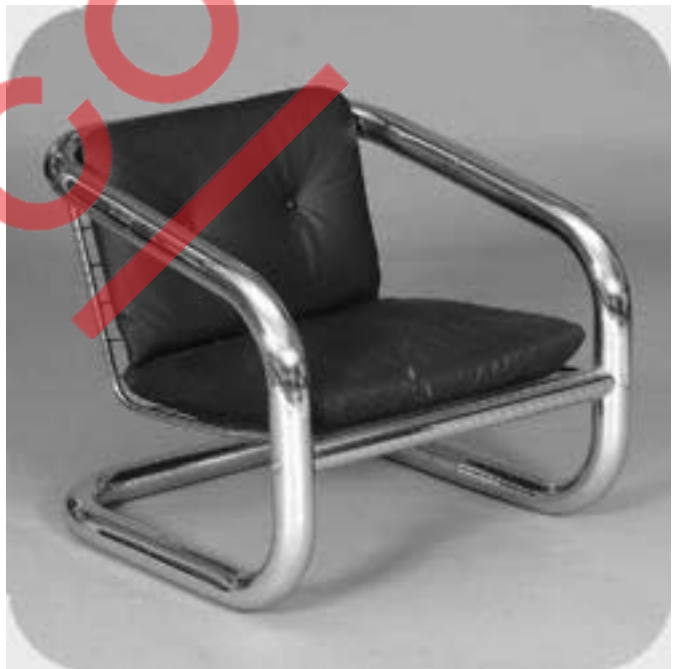
Banco redondo feito para a Pinacoteca do Estado de São Paulo.