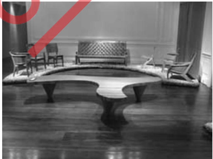
Exposição Museu da Casa Brasileira