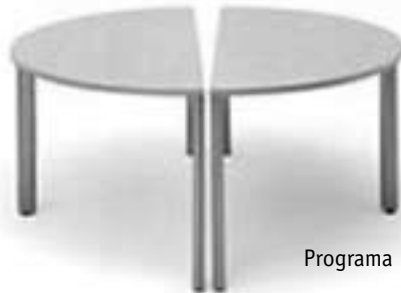
Programa EA4, 1996