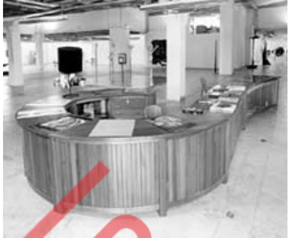
Museu de Arte Contemporânea - MAC USP