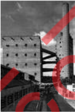
Casa de Vidro, 1951.