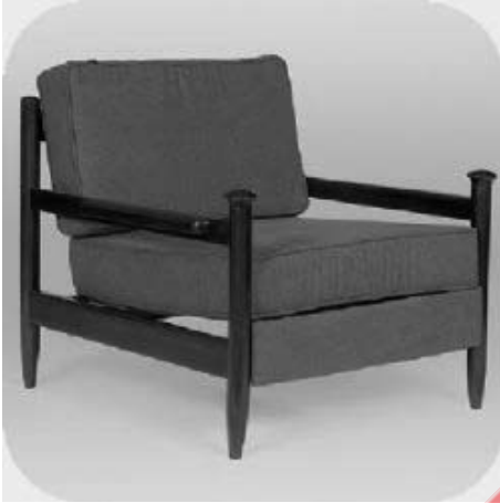
Poltrona em jacarandá, 1962.