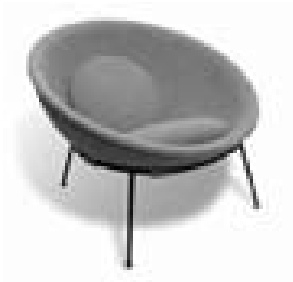
Cadeira Bowl, 1951