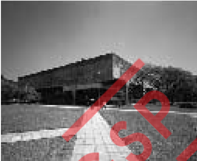
Edifício sede da Faculdade de Arquitetura e Urbanismo da Universidade de São Paulo, 1948.