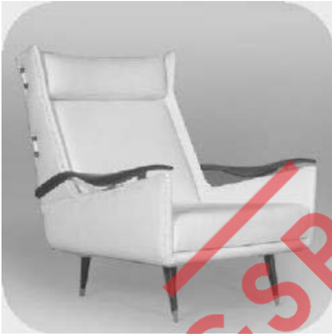
Poltrona em jacarandá, 1958.