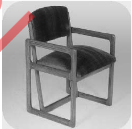
Poltrona em jacarandá, 1958/64.