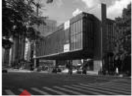
MASP, Museu de Arte Moderna de São Paulo, 1947.