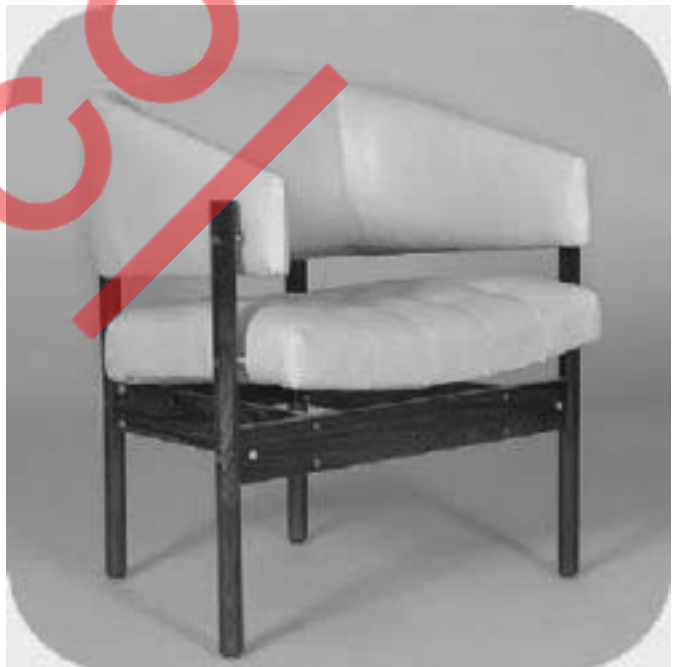
Poltrona em jacarandá, 1957.