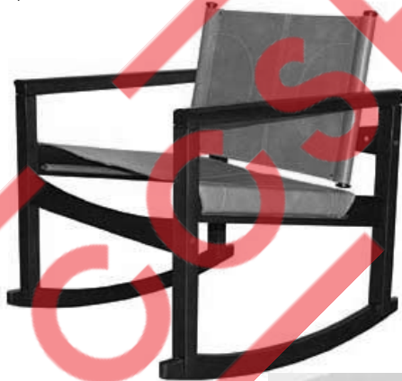
Cadeira Peg Lev em jacarandá e produzida pela Mobília Contemporânea, 1968.