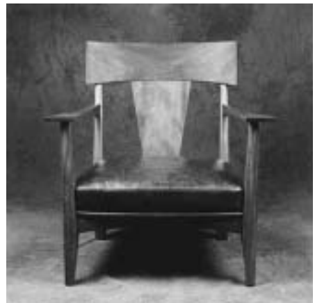
Poltrona CM7a