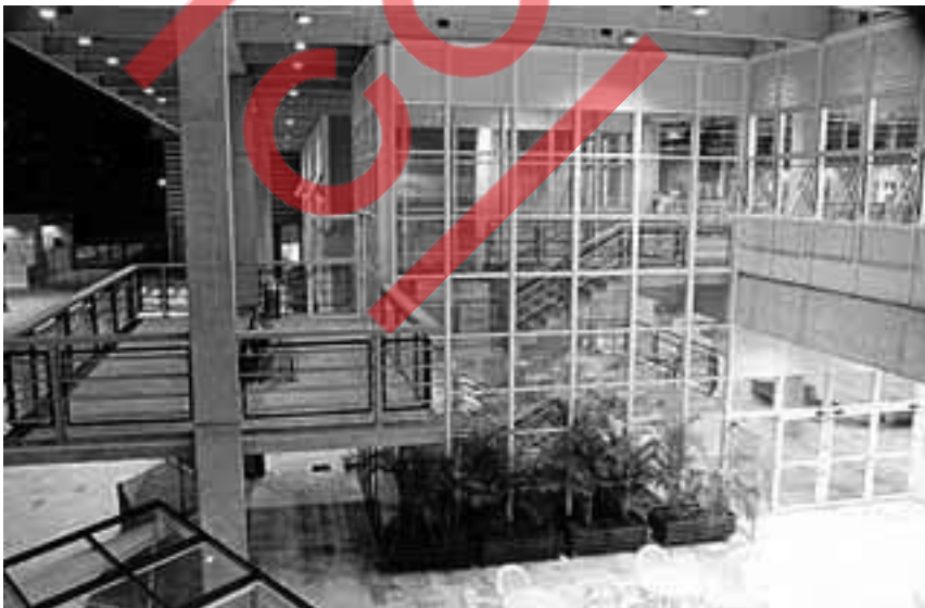
Área interna do Sesc Araraquara, 1991.