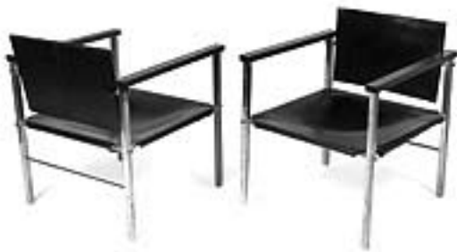
Cadeira SBM 680, 1958