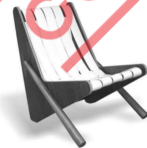
Poltrona em multilaminado, 1947.