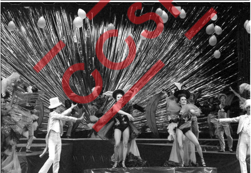
Aquarela do Brasil, 1979