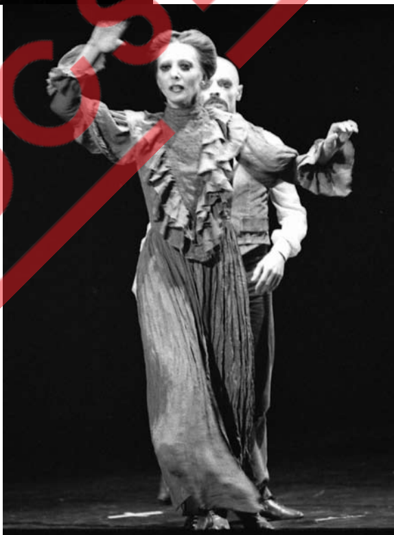
Cenas de Família, 1978 Corpo de Baile Municipal Coreografia Oscar Araiz Interpretação Iracity Cardoso