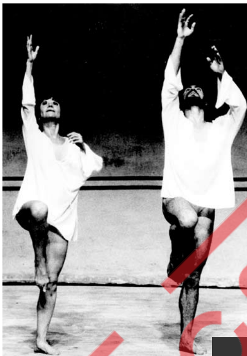
Um Sopro de Vida, 1979